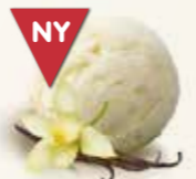
Laktosefri is med vanilje 56220