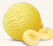
Banan Flødeis med banan 52207