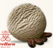
Kaffe Flødeis med Frellsen kaffe 52251