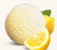
Citron Sorbet Sorbet af solgule citroner 56212