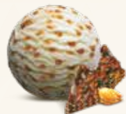
Nougat Flødeis med nougat 52215