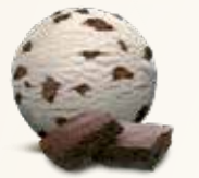
Brownie Flødeis med chokoladecake 52232