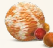
Tyggegummi Flødeis med smag af tyggegummi 52223