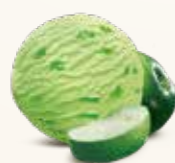
Grøn Æble Sorbet Sorbet af grønne æbler 56207