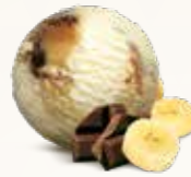
Bananasplit Flødeis med banan og kakaosauce 52217