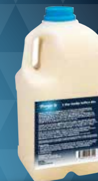
Frisk fløde-softice mix 2,0 liter - skal opbevares på frost