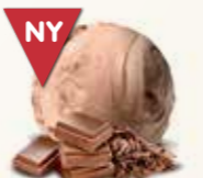
Laktosefri is med mælkechokolade 56221