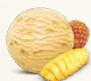
Ananas Sorbet Sorbet af forfriskende ananas 56206