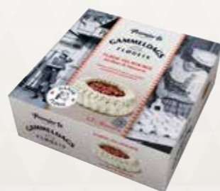
Flødeislagkage Jordbær & Mazarin 1,3 l. 52412