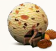
Rom & Rosin Flødeis med rosiner og chokolade 52233