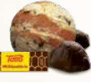
Skildpadde Flødeis med romcreme og karamel 52211