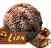
Lion Vanilleis med karamelsauce og crisp 56209