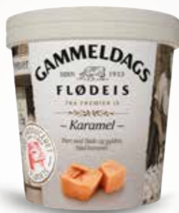
Gammeldags Flødeis Karamel 125 ml bæg 52526