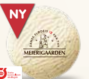
Øko Vanilje Økologisk Flødeis med bourbonvanilje 52260