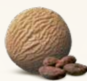
Kakao Flødeis med kakao 52225