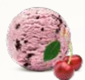
Kirsebær Flødeis med kirsebær og chokolade 52235