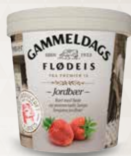
Gammeldags Flødeis Jordbær 125 ml bæg 52525