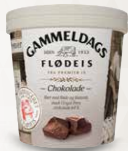
Gammeldags Flødeis Chokolade 125 ml bæg 52527