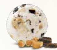
Cookie Dough Flødeis med cookie dough stykker 52245