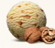
Valnød Flødeis med karamelliserede valnødder 52221