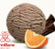
Choko/Orange Flødeis med stykker af orangetunger 52249