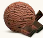
Chokolade Flødeis med mørk chokolade 52216