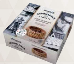
Flødeislagkage Kakao & Brownie 1,3 l. 52413