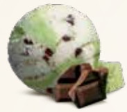
Choko-Marcipansmag Flødeis med marcipansmag 52214