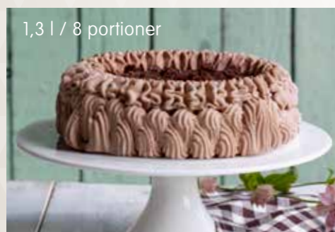
1,3 l / 8 portioner