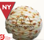
Øko Nougat Økologisk flødeis med nougat 52264