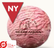
Øko jordbær Økologisk jordbærflødeis med jordbærstykker 52261