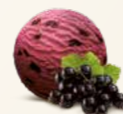
Solbær Sorbet Sorbet af modne solbær 56203