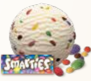
Smarties Vanilleis med chokoladepastiller 56210