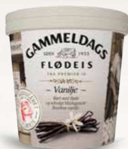
Gammeldags Flødeis Vanilje 125 ml bæg 52524

Kakao & Brownie, Jordbær & Mazarin og Hindbær & Vanilje.