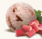
Rabarber Rabarberflødeis med rabarbersauce 52252