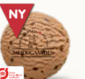
Øko chokolade Økologisk flødeis med chokolade 52262