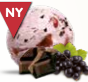
Kæmpe Eskimo Flødeis med solbærsauce og chokoladestykker 52256