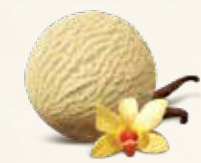
Bourbonvanilje Flødeis med bourbonvanilje 52226