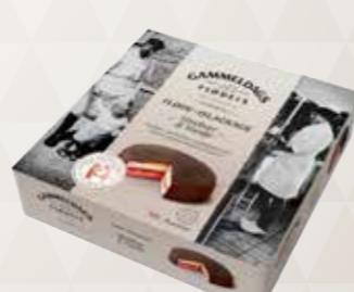
Flødeislagkage Hindbær & Vanilje 800 ml. 52440