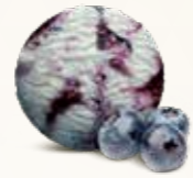
Blåbær Flødeis med blåbær 52218