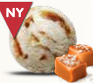
Saltkaramel Flødeis med blød saltkaramel 52255