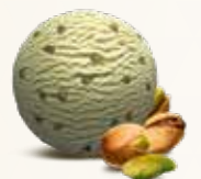
Pistacie Flødeis med pistaciensødder 52213