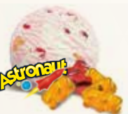
Astronaut Limonadeis med vingummi 52253