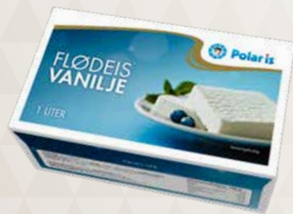
Flødeis vanilje 52806