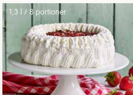
1,3 l / 8 portioner