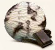
Stracciatella Flødeis med belgisk chokolade 52209