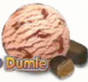
Dumle Flødeis med karamel og chokolade 52241