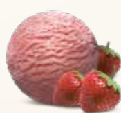
Jordbær Sorbet Sorbet af solmodne jordbær 56211