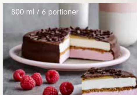
800 ml / 6 portioner