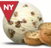
Koldskål Flødeis med kærnemælk og knuste kammerjunker 52254