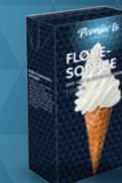
UHT fløde-softice mix 2,0 liter