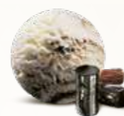
Lakrids Flødeis med lakrids 52236