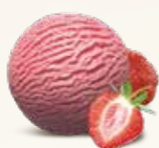
Jordbær Flødeis med jordbær 52210