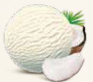
Kokos Kokosis af tropisk kokosnød 56213